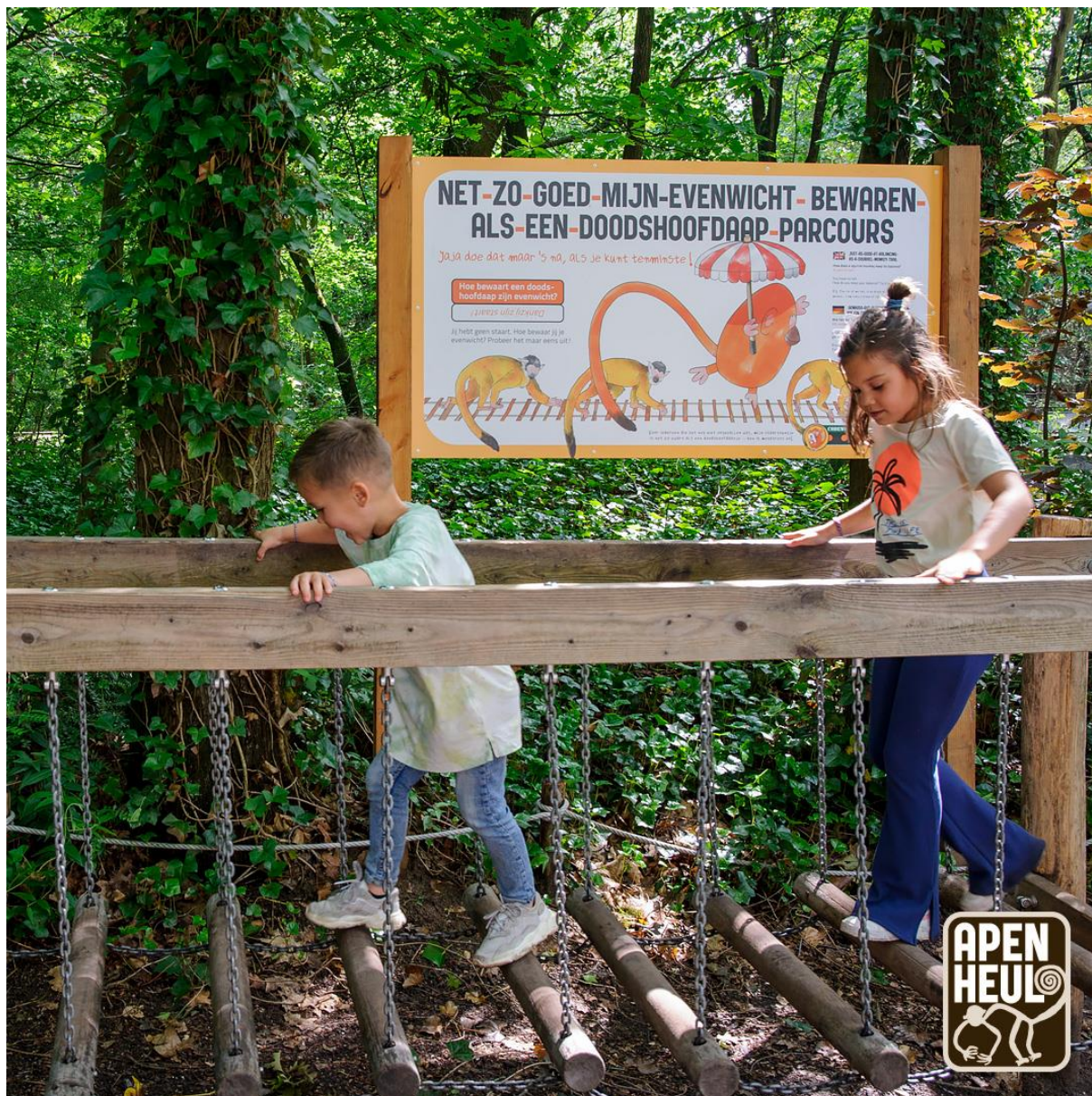
Nieuw in 2022: allerlei Naaap activiteiten, zoals de evenwichtbalk