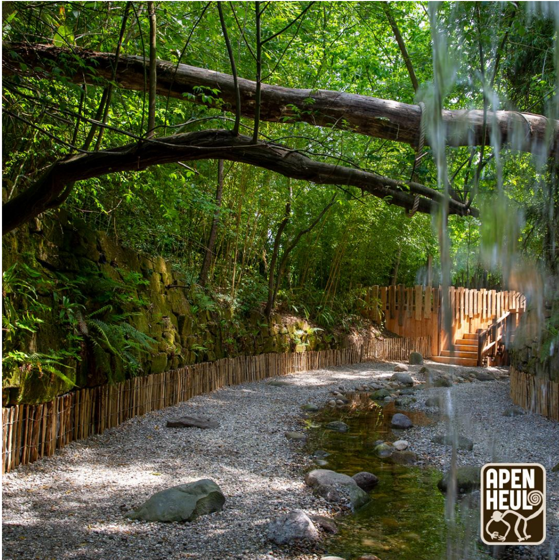
Nieuw in 2022: het Avonturenpad